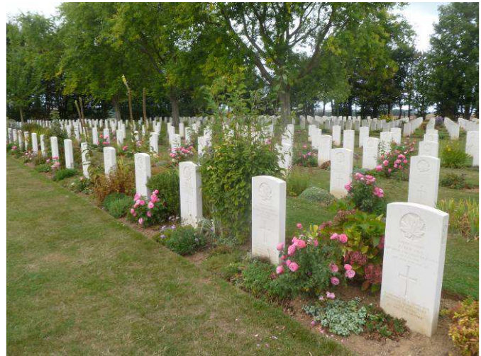
Revers: Cimentière Canadien 2.052

Indrukwekkend zijn de oorlogsbegraafplaatsen dicht bij de kust gelegen. Omaha Beach, de American Cemetery Colleville 9.387 graven. Revers het Cimentière Canadien , 2.025 Canadezen, 7 Britten en 1 Fransman, La Cambe de Duitse begraafplaats 21.160 graven. Bayeux grootste Britse militaire begraafplaats in Frankrijk, 4648 man. Op deze begraafplaats liggen 181 Canadezen, 17 Australiërs, 8 Nieuw-Zeelanders, 1 Zuid-Afrikanen, 24 Polen, 7 Russen, 3 Fransen, 2 Tsjechen, 2 Italianen en 466 Duitsers. Op het monument aldaar staan nog eens 1.801 gesneuvelden soldaten die geen gekend graf hebben.