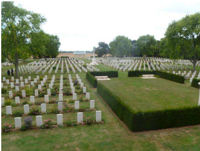
Bayeux: Britse begraafplaats 4.648