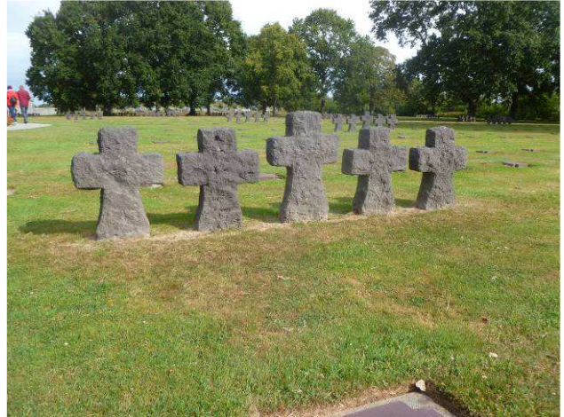
La Cambe, Duitse begraafplaats 21.000