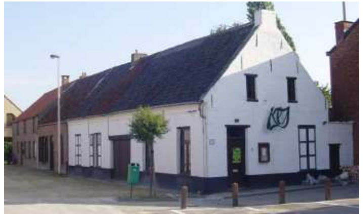
hoek Dorpsplaats - Smishoek

1990: Oud gemeentehuis Boechout. Oorlogsmonument 1940-1945 onthuld op voorplein van gemeentehuis Populierenhof 9 mei 1948, mei 2003 overgebracht naar voortuin gemeentehuis Heuvelhof (Heuvelstraat 91)