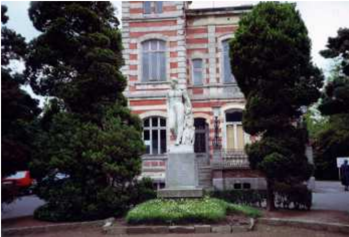
Dr. Theo Tutsstraat 20

(registratie via hetspeelhof@gmail.com )