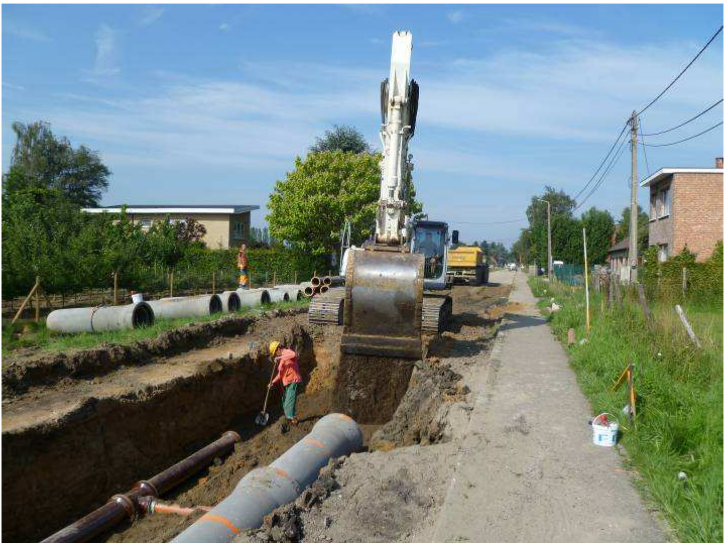
Start van de heraanleg van de Vremdesesteenweg voorjaar 2011

2004: Rechts het voormalige KLJ-lokaal in de lange woning waar vóór 1813 café De Ploeg was. Links ervan het huidig lokaal van de heemkundige kring Het Speelhof en Natuurpunt-Land van Ryen